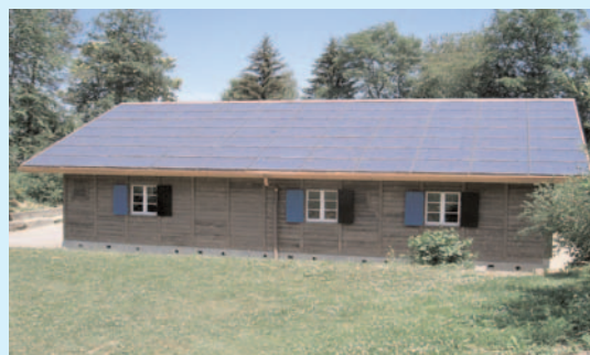
MegaSlate® Solardach auf dem Pfadfinderheim Büschi in Köniz (Schweiz)