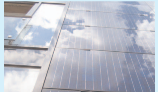
Vorgehängte 3S Swiss Solar Systems Fassade in Landsberg am Lech (Deutschland)