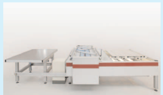
Lay-Up Station LS1812