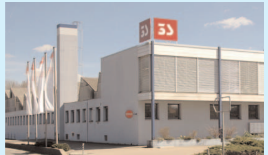
Firmensitz 3S Swiss Solar Systems AG in Lyss (Schweiz)

Bei den von uns angebotenen Solarsystemen handelt es sich um hochwertige gebäudeintegrierte Photovoltaikanlagen, die als Indachsystem - zur vollständigen oder teilintegrierten Dacheindeckung - , als Fassadensystem oder als Sonnenschutz eingesetzt werden. Wir produzieren ausschließlich rahmenlose Solarmodule (auch Solarlamine genannt), die eine sehr ästhetische Optik haben und an denen sich ein biologischer Bewuchs